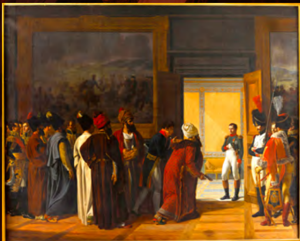
© Napoléon I er recevant à Finkenstein l'ambassadeur de Perse (AMN)