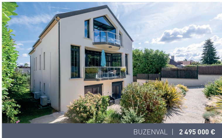
BUZENVAL | 2 495 000 €

Maison d'architecte, 7 pièces, 6 chambres, 314m 2 Honoraires charge vendeur. DPE C/C.