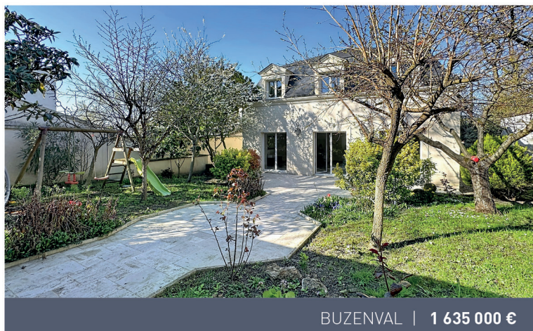
BUZENVAL | 1 635 000 €

Maison de caractère, 8 pièces, 5 chambres, 216m 2 . Honoraires charge vendeur. DPE F/F.