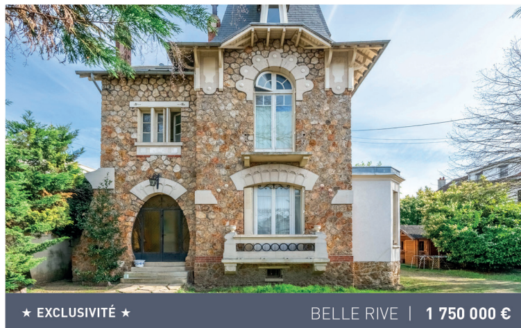
★ EXCLUSIVITÉ ★

Maison d'architecte, 7 pièces, 6 chambres, 314m 2 Honoraires charge vendeur. DPE C/C.