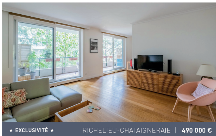
★ EXCLUSIVITÉ ★

Appartement familial, 5 pièces, 3 chambres, 110m 2 . Honoraires charge vendeur. DPE E/B.