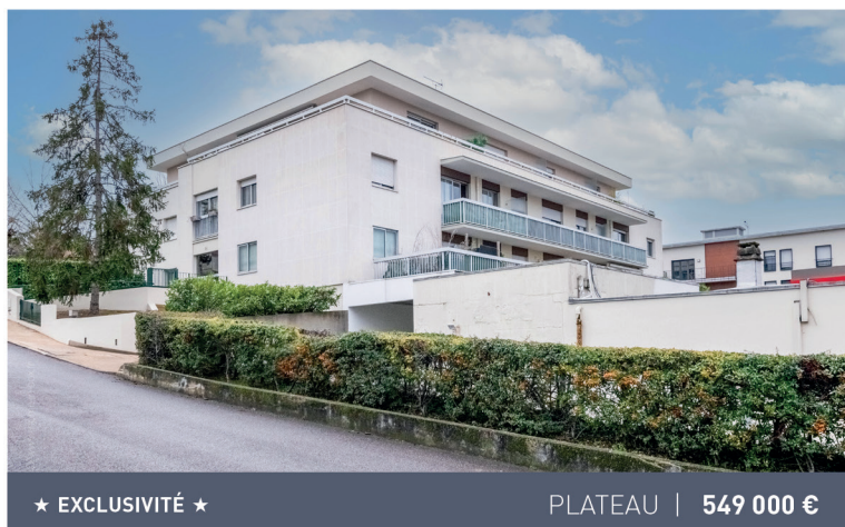
★ EXCLUSIVITÉ ★

Maison de charme, 5 pièces, 4 chambres, 114m 2 . Honoraires charge vendeur. DPE F/F.