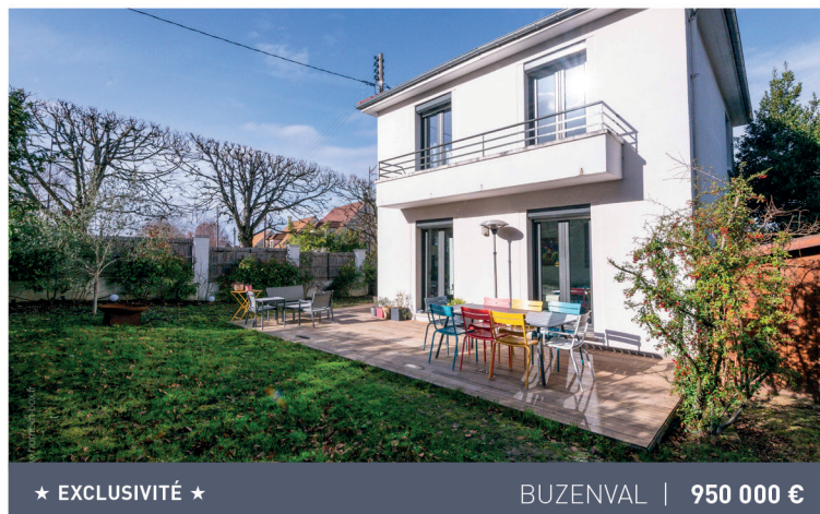
★ EXCLUSIVITÉ ★

Maison familiale, 6 pièces, 4 chambres, 192m 2 . Honoraires charge vendeur. DPE C/C.