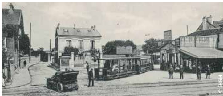
▲ Rueil - La gare du tramway et la rue du Vieux-Pont.