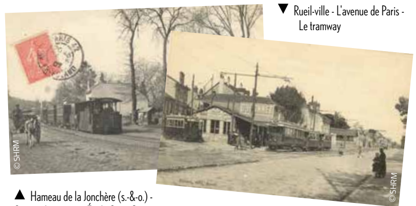
▼ Rueil-ville - L'avenue de Paris - Le tramway

Les chevaux cédèrent la place à des locomotives à vapeur classiques puis à des locomotives Francq sans foyer. Leur originalité était de ne pas utiliser de charbon à bord : à la station de départ, leur réservoir était chargé de vapeur sous pression et elles partaient avec suffisamment d'énergie accumulée pour atteindre leur terminus. Ce système avait, certes, l'avantage de limiter les effets incommodes de