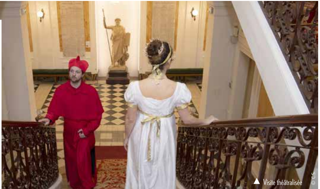
▲ Visite théâtralisée

Entre modernisation du parcours de visite, nouvelles offres culturelles et dispositifs immersifs, le musée d'Histoire locale multiplie les initiatives pour toucher un public toujours plus large. Lieu patrimonial incontournable, il affirme plus que jamais sa volonté de transmettre l'histoire de Rueil-Malmaison de manière vivante, accessible et résolument tournée vers les nouveaux usages. Comment ? ▶ Morgane Huby